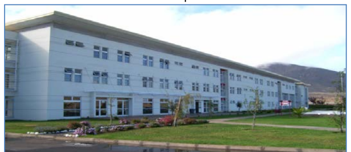
Establecimiento Penitenciario de La Serena