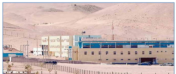
Establecimiento Penitenciario de Alto Hospicio